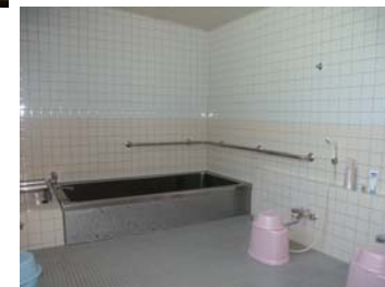
午後は入浴もできます。