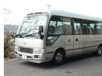
送迎については デイケア・デイナイトケア のスタッフまで お問い合わせください。