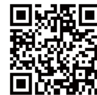
最新のプログラムは こちらからご覧いただけます。