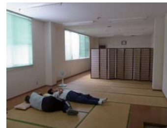
静養室も 利用できます。