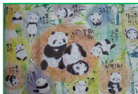
ジグソー パズル 「パンダ ちゃん」 (300ピース) by Y・U