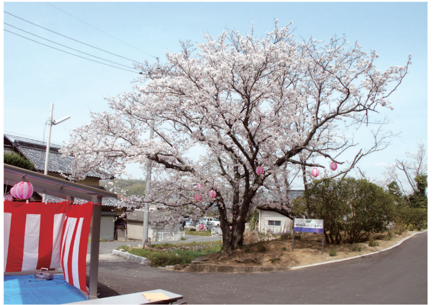
(2007 年 4 月撮影)